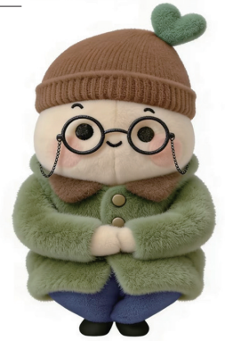
报告老几，什么是老式人