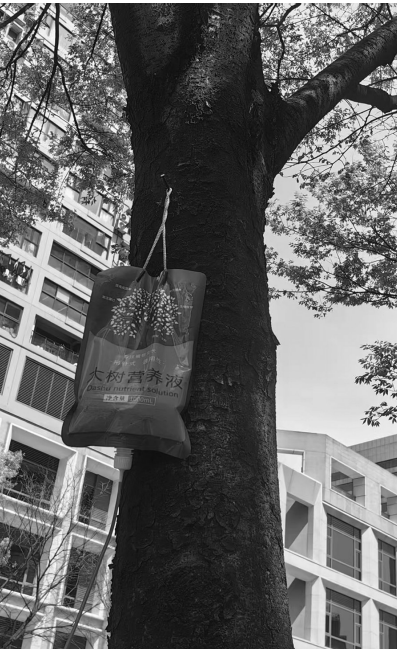
路边的树挂着营养瓶。