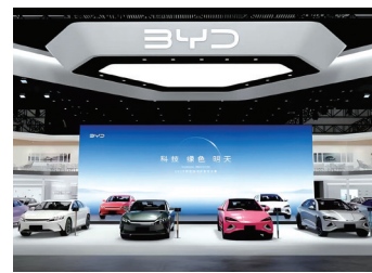
比亚迪跻身全球汽车领先阵营。