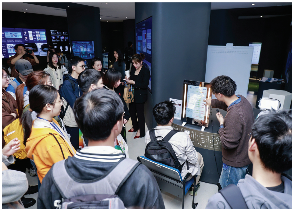
“青聚星火·来看闵行”青年创新生态赋能行动邀请所有怀揣梦想的青年朋友共赴青春之约。

以赛事成果转化为抓手，推动一批青年优秀项目、前沿科技成果从“实验室”走向“生产线”、从“竞赛场”融入“产业链”。在第五届“海聚英才”全球创新创业峰会上，赛因斯科技创始人、闵行