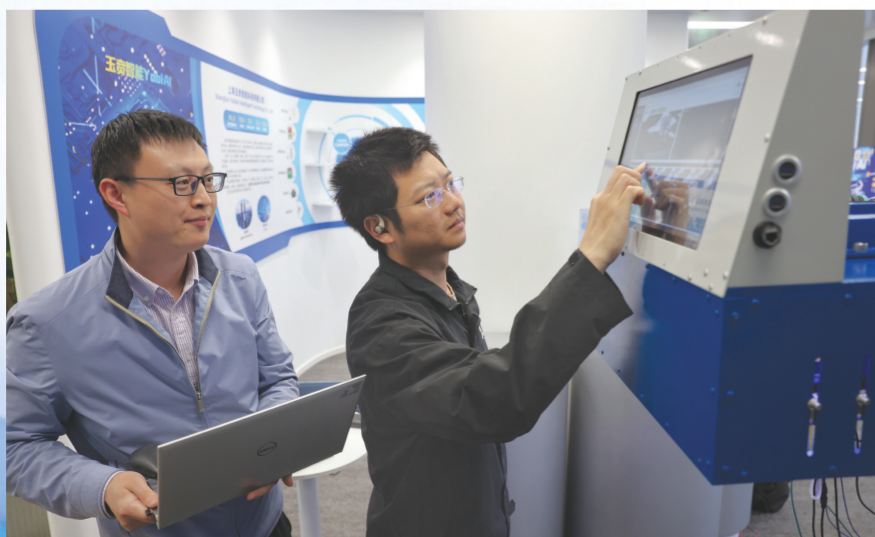
玉贡智能工作人员调试出口设备。

一年前,他们带着梦想走进模力社区。一年后,他们带着产品走向世界。而这里,每天仍有新的“上下楼”故事在发生——在电梯里,在茶水间,在沙龙分享中。这或许就是这个“创新策源地”最珍贵的产出:不仅仅是代码或是专利,而是一种让年轻人相信“我在这里能改变世界”的蓬勃力量。