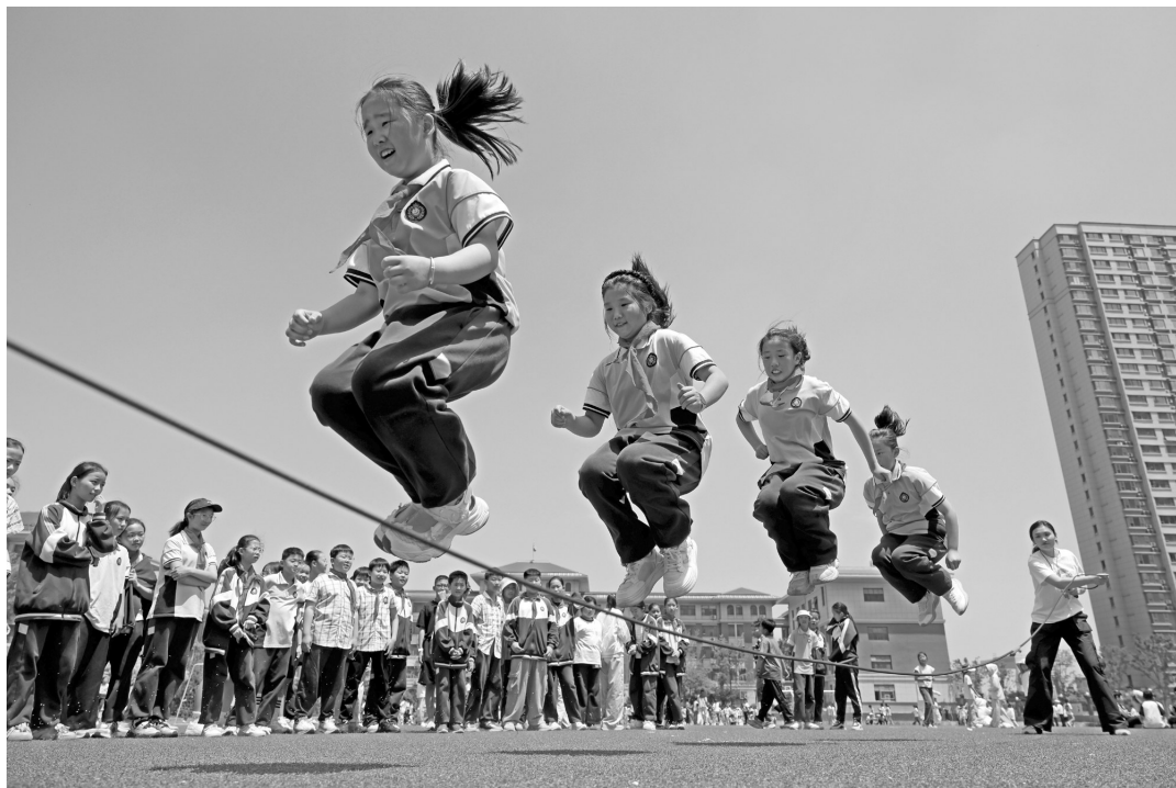
学生参加跳绳比赛。

由于超重的学生易被嘲笑和孤立，可能出现自卑、社交回避等心理健康问题。“心理问题又可能引发暴饮暴食，陷入越胖越吃、越吃越胖的恶性循环。”陈琪补充道。