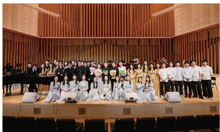
宝山·东华青年主题音乐会。