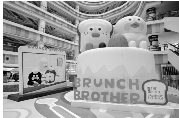
“BRUNCH BROTHER” 全国首展登陆虹桥南丰城。

源自韩国 Romane Corp. 的“BRUNCH BROTHER”，是根植于早午餐文化的治愈系标杆 IP。IP 以烤吐司与小黄鸭为核心形象，搭配一众萌趣伙伴，凭借简约松弛的风格，成为当代年轻人纾解压力、安放情绪的精神寄托。本次首展巧借面包制作的核心工