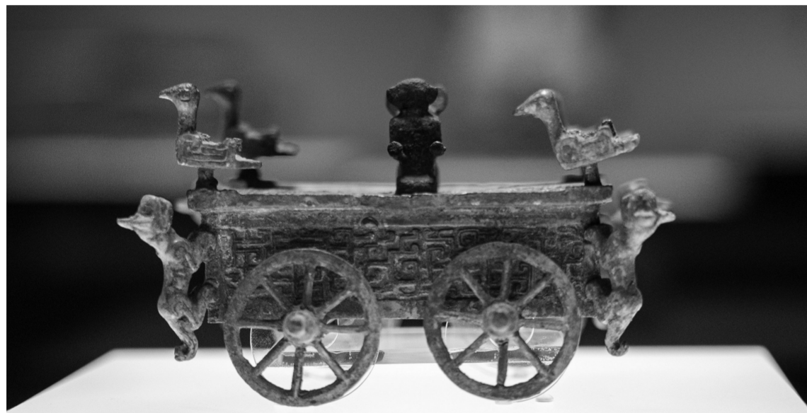
上博“何以中国”第五展展出的文物。