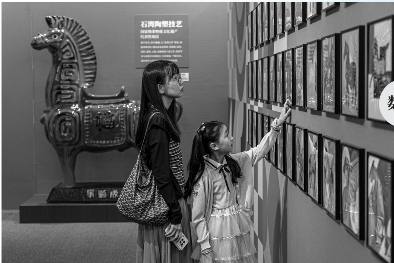
“神马都好玩：当达拉木马遇见中国非遗”展上，观众在欣赏精彩的展陈。