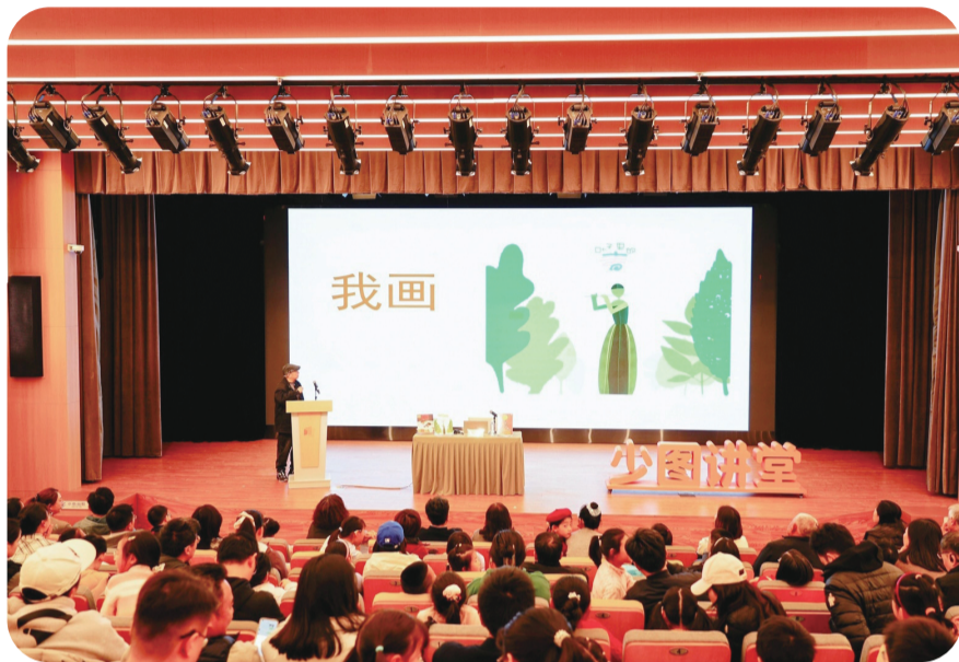
上海少儿阅读如火如荼。

儿童文学、漫画与图画书依然占据主导，冒险、侦探与奇幻题材持续火热，科普百科类图书覆盖面广；AI成为青少年重要的阅读助手——近日发布的《2025年上海市公共图书馆少年儿童阅读报告》和《2025上海市民阅读状况调查》显示，目前上海青少年的阅